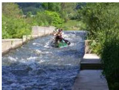
Wasserrutsche bei Witten

Die Pfingstfahrt der Kanuabt. des SV 47/63 Stockum führte diesmal, ganz nach dem Motto: „Warum in die Ferne schweifen, denn die Ruhr liegt so nahe“, in den Mittelpunkt des Ruhrgebiets, nämlich auf die Ruhr.