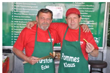
Wurstchen Ecko und Pommes Klaus beim REWE-Symalla-Cup

Eine tolle Fahrt haben die Kinder und Jugendlichen am Sonntag, 17. Mai erlebt. Die Ausstellung im Nixdorf-Museum ist bei den Teilnehmern sehr gut angekommen. Besonders das Klettern im Klettergarten und das Minigolfspielen war im Anschluss daran ein weiteres Highlight. Es bleibt zu wünschen beim nächsten Termin weitere Kinder und Jugendliche für solche Aktivitäten zu begeistern.